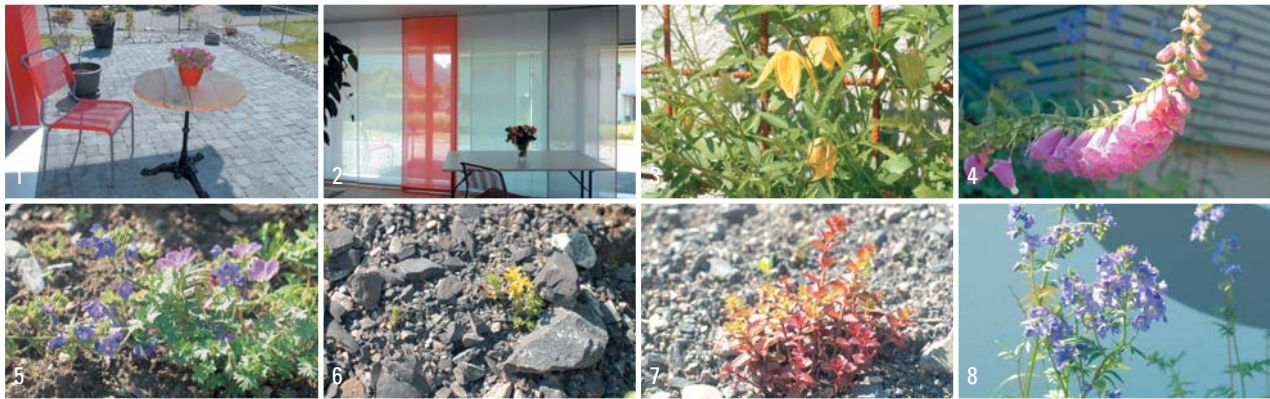
1+2) Im Studio kann man sich von der Wohnqualität im Minergie-P-Eco-Haus überzeugen. 3-8) Nachhaltig schön: Einheimische Pflanzen rund ums Haus.

tigkeit: Sie fahren Velo statt Auto, kaufen Lebensmittel aus der Region, verzichten auf Fernreisen mit dem Flugzeug. Nachhaltig zu bauen war für die beiden selbstverständlich. Ein möglichst sinnvolles Energiekonzept stand deshalb ebenso auf dem Kriterienkatalog, der dem Architekten vorgelegt wurde, wie der Einsatz baubiologisch geprüfter Materialien, von den Platten bis zum Verputz. Daraus ergab sich als logische Folge ein Haus im Standard Minergie-P-Eco.